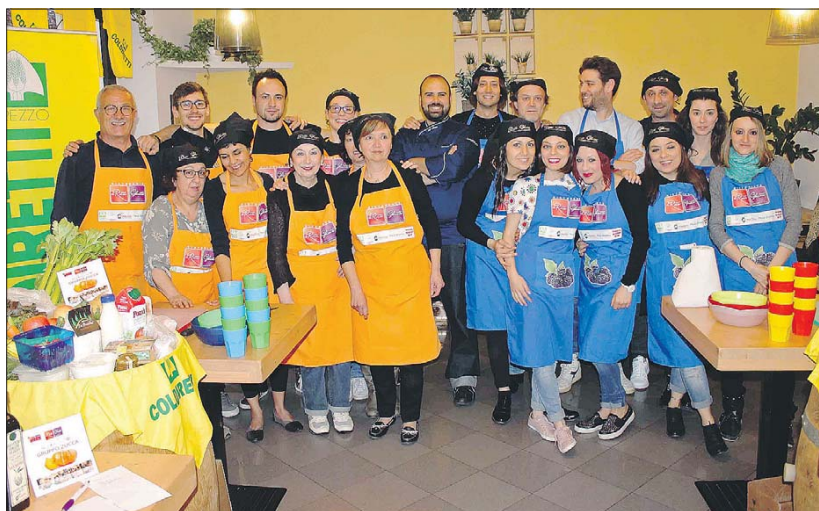
Social Cooking Ecco le due squadre partecipanti, "Mora" e "Zucca", che si sono date battaglia a colpi di piatti succulenti

Nell'ambito del ciclo "Schegge di memoria: storia e vita quotidiana dagli archivi del territorio aretino" si svolgerà domani alle 17.30 un incontro alla sala conferenze della Biblioteca Città di Arezzo dal titolo: "La memoria della vita contadina: documenti e immagini per non dimenticare". L'incontro vedrà l'intervento di Ivo Biagianti, storico dell'Università degli studi di Siena, che farà un breve inquadramento storico sulla Valdichiana, gli sviluppi delle bonifiche, la realtà mezzadrile, il sistema fattoria con un focus sulle proprietà della famiglia Mancini-Griffoli e sulla documentazione tramandata. L'incontro sarà l'occasione per vedere alcuni documenti originali della famiglia, conservati presso la biblioteca e per assistere alla proiezione di un video che illustra quella che era la realtà contadina degli inizi del Novecento. Info su www.bibliotecarezzo.it , pagina facebook BibliotecaCittadiArezzo. Telefono 0575-22849. ◀